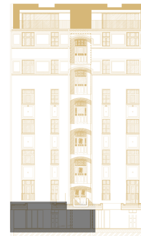
Pohled na dům